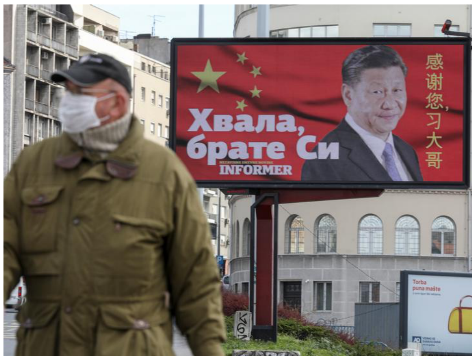
Abb. 1: Ein Plakat zum Dank für die chinesische Hilfe im Kampf gegen das Covid-19-Virus mit der Aufschrift „Danke, Bruder Xi“ in der Belgrader Innenstadt.

Deshalb ist zu erwarten, dass die EU an Ansehen verliert, während Chinas Reputation und Einfluss steigen. Im Westen werden verstärkt Bedenken geäußert, Chinas Engagement führe zu einer Entfremdung der 17+1-Staaten – insbesondere der Staaten des Westlichen Balkans – von der EU und zeige ihnen strategische Alternativen auf. Wie lässt sich also das hohe Niveau der sino-serbischen Beziehungen erklären und was bedeutet es für die Region? Lassen sich daraus Rückschlüsse für eine angemessene Reaktion der EU auf Chinas zunehmende Präsenz in Mittel- und Osteuropa ziehen?