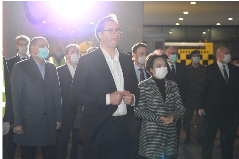
Abb. 2: Präsident Vučić (Mitte) und Chinas Botschafterin Chen Bo (rechts) erwarten chinesische Hilfslieferungen und -personal.

Covid-19-Pandemie zunehmend fern, während China Solidarität und Handlungsfähigkeit demonstriert. So ist zwischen 2009 und 2017 die öffentliche Zustimmung zu einem EU-Beitritt von 67% auf 43% gesunken, während die Ablehnung von 16% auf 35% stieg. Gleichzeitig wird die „Neue Seidenstraße“-Initiative in keinem 17+1-Land so positiv wahrgenommen wie in Serbien. Es wird erwartet, dass sich dieser Trend im Zuge der Pandemie fortsetzt und China weiter an Popularität gewinnt. In diesem Sinne ist Chinas „Masken-“ und „Impfdiplomatie“ als erfolgreich zu bewerten.